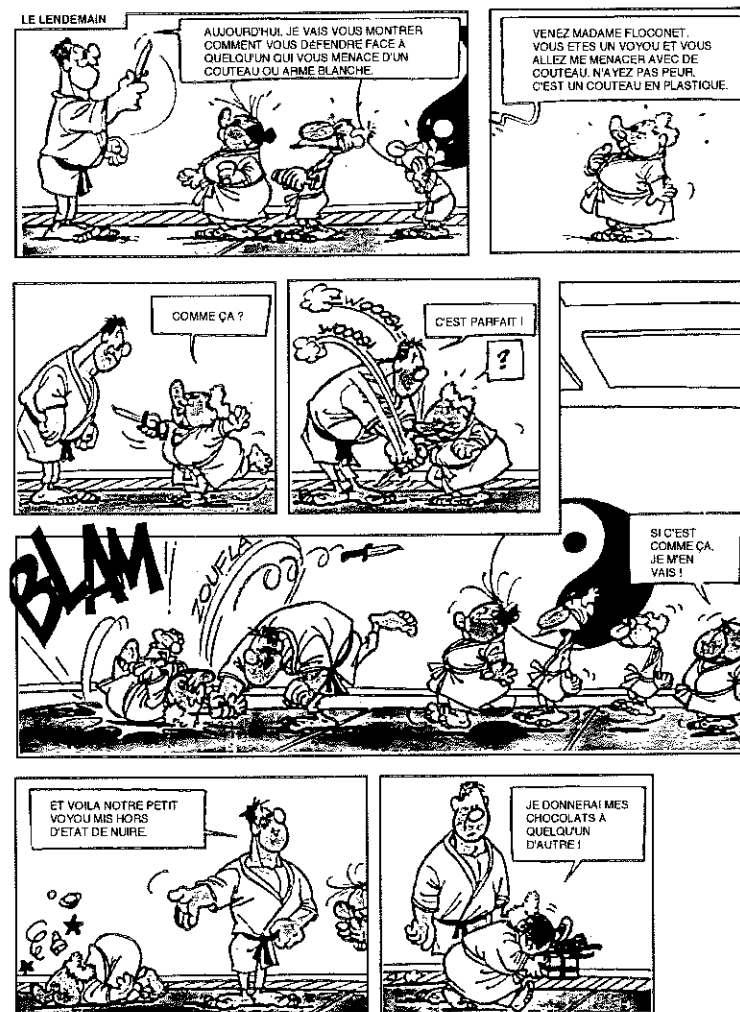
Extrait de « Mamy se défend » par Geerts.

Cours de self-défense pour seniors ! (3 ème leçon)