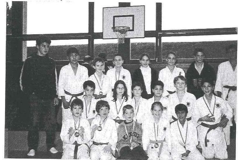
L'équipe écoliers du Judo Kwai 1997